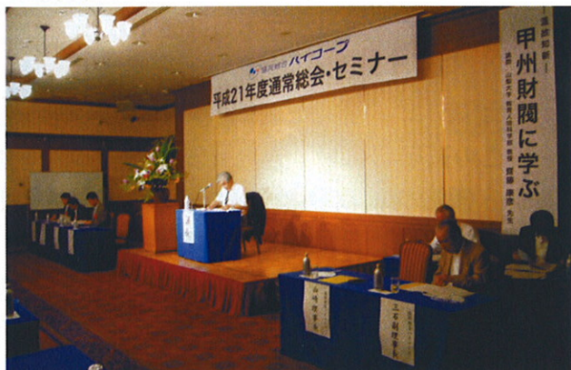
◆平成21年度通常総会 (山梨県甲府市 富士屋ホテルにて開催)