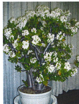
◆こいつは春から縁起がいいや! 「満開の金のなる木」 平成22年元旦撮影