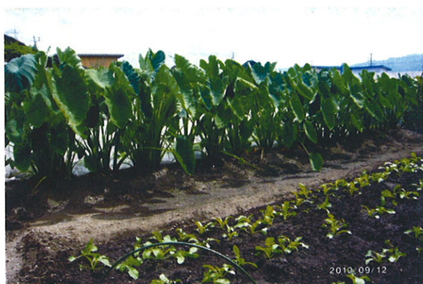
◆メンバーの生ゴミ堆肥とEMで育つ里芋 食品循環実験「EM普及菜園」

9月号 協同組合ハイコープ組合報 Vol.192 2010年(平成22年)9月21日(火)発行