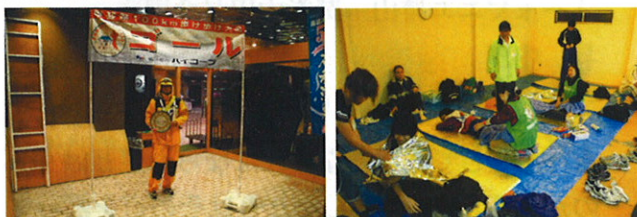
◆10/9~10/10 山梨地区本部主催 第6回甲斐路100km歩け歩け大会開催