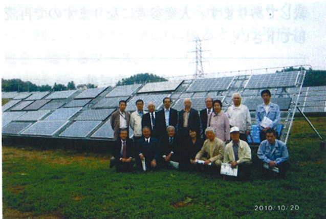
◆10/20 長野県地区本部主催 大規模太陽光発電研究所視察

11月号 協同組合ハイコープ組合報 Vol.193 2010年(平成22年)11月15日(月)発行