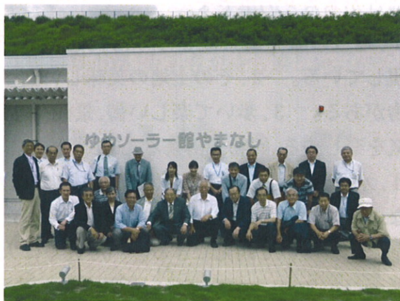
◆7/12 山梨地区本部主管イベント 「米倉山太陽発電所& ゆめソーラー館やまなし」視察